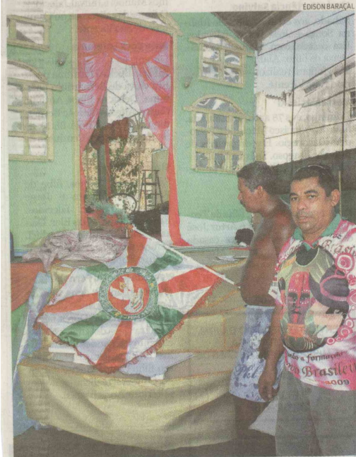
A escola aposta nas cores das fantasias e na garra de seus passistas